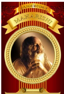
Yogi Maharishi Mahesh