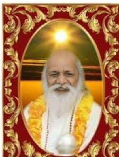
Maharishi Mahesh Yogi

En 1976, j'avais 16 ans, j'ai fait un rêve prémonitoire. Dans ce rêve, quelqu'un me touche et je me mets à voler. Deux mois passent et par hasard je tombe sur une affiche qui annonce une conférence sur la méditation transcendantale. Sur l'affiche,